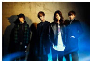
11日 THE BEAT GARDEN