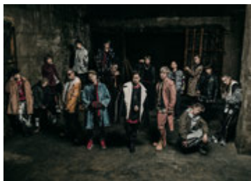
11日 THE RAMPAGE from EXILE TRIBE