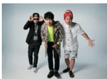
10日 ベリーグッドマン

「FM802×大阪オートメッセ」による本格ライブステージ“カスタマイズアリーナ”では、豪華ゲストによる連日のライブ&パフォーマンス。来場者ならどなたでもご覧いただけます。ライブの詳細は大阪オートメッセのWEBでチェック!!